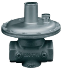
SRV 801 / 811