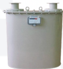
G65 Y G100

-Tipo de gas: Gas natural, aire, propano, butano, nitrógeno, hidrógeno y todo gas no corrosivo.