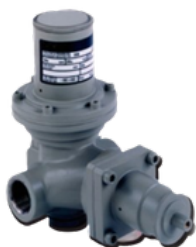
RB 1700 - 3/4"