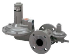
133 Y 233