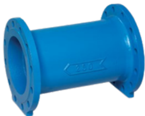
ESTABILIZADOR DE FLUJO

-Eliminan las perturbaciones del caudal que puedes afectar a la precisión del contador. Se instalan principalmente aguas arriba de los contadores Wotmann horizontales para enderezar el flujo alterado por válvulas, filtros, codos o bombas.