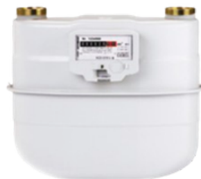
ACD G10 Y G16

-Tipo de gas: Gas natural, aire, propano, butano, nitrógeno, hidrógeno y todo gas no corrosivo.