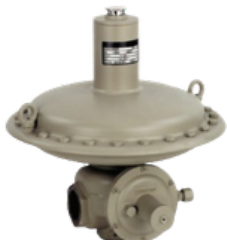
RB 1700 Y RB 1800