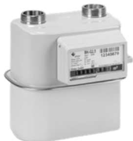
G4 Y G6

-Tipo de gas: Gas natural, aire, propano, butano, nitrógeno, hidrógeno y todo gas no corrosivo.