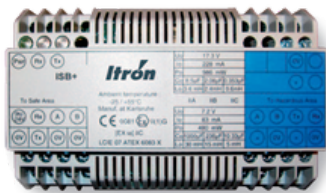
ISB + PUERTO SERIE