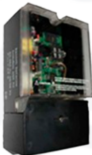
INDUBOX GSM M4

-El acceso a la configuración del equipo se realiza a través de la página web, dirección IP 10. 10. 10. 10, mediante usuario y password (admin/ admin).