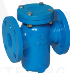
FILTRO DE CESTA

-El diseño robusto y compacto permite una instalación fácil y segura manipulación en el tiempo incluso en condiciones adversas. El cuerpo de fundición de hierro está protegido por pintura epoxy y los elementos de filtrado son de acero inoxidable.