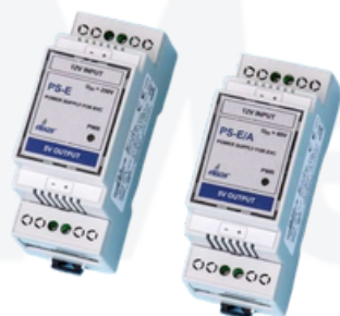
PS-E FUENTE DE ALIMENTACIÓN