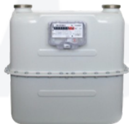
G25 Y G40

-Tipo de gas: Gas natural, aire, propano, butano, nitrógeno, hidrógeno y todo gas no corrosivo.