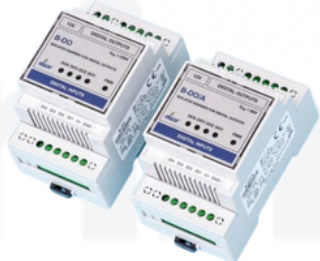
B-DO SEÑALES DIGITALES