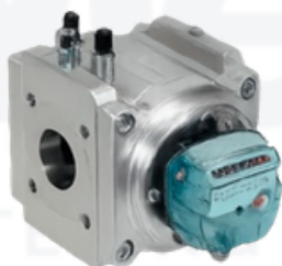
DELTA SILVER & EVO