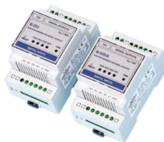
B-RS PUERTO SERIE